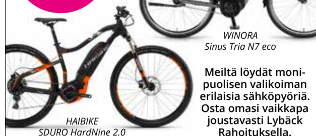
WINORA Sinus Tria N7 eco

Meiltä löydät moni- puolisen valikoiman erilaisia sähköpyöriä. Osta omasi vaikkapa joustavasti Lybäck Rahoituksella.